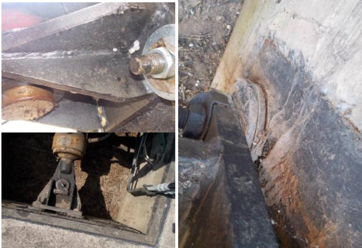
Poškozené závěsy vzpěrných vrat VPK v DO