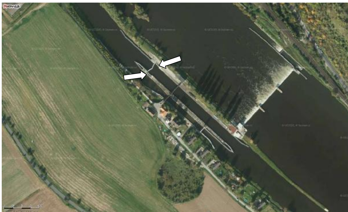
VD Dolní Beřkovice . ortofotomapa

VD Dolní Beřkovice, oprava uchycení pohonů vzpěrných vrat v dolním ohlavi VPK